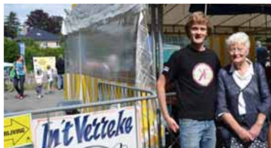
De Volksfeesten van Moorsel, zoals steeds ten voordele van een goed doel!