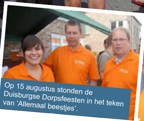
Op 15 augustus stonden de Duisburgse Dorpsfeesten in het teken van 'Allemaal bestjes'.