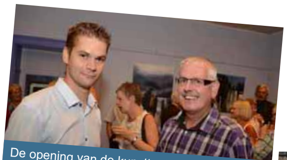
De opening van de kunsttentoonstelling in Pachthof Stroykens (Duisburg).

Dankzij de inzet van vele vrijwilligers, leefde Tervuren de voorbije zomer verrassend veelzijdig op! Onze CD&V-kandidaten waren hierbij regelmatig van de partij.