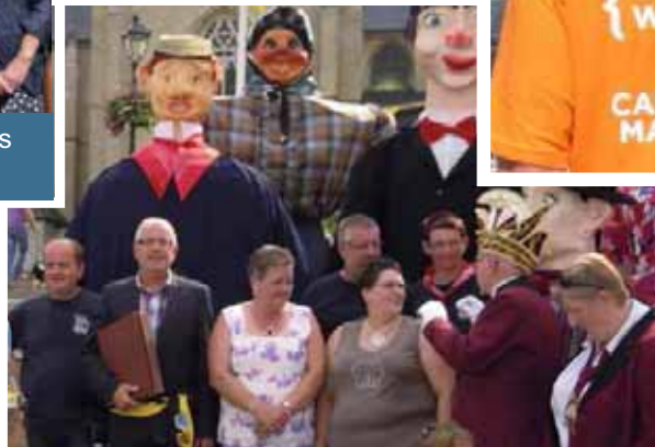
De reuzenfamilie van Tervuren deed aan uitbreiding: het Feestcomitee Der Reuzen van Tervuren adopteerde drie reuzen uit Bilzen. Dit werd gevierd tijdens de Reuzenfeesten. Op deze foto is de verwelcoming van de reuzen te zien, die gevolgd werd door de inschrijving in het Gulden Boek van de gemeente.